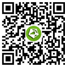
雅昌艺术网 官方微信